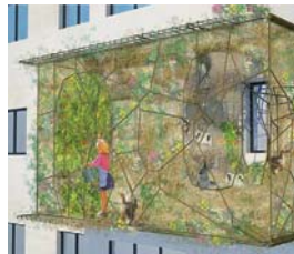
Philippe Krych Architecte « Résille agricole » 19 rue des Couronnes 75020 Paris